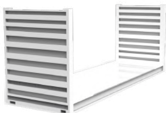
Flat Rack - 20 pieds