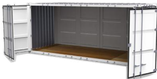
Open Side - 20 pieds