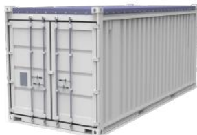
Dry Open Top - 20 pieds