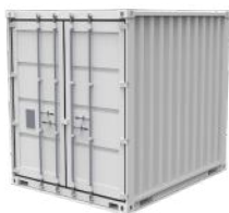
Dry - 10 pieds