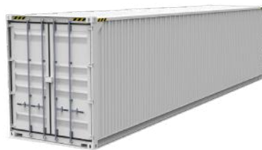
High Cube - 40 pieds